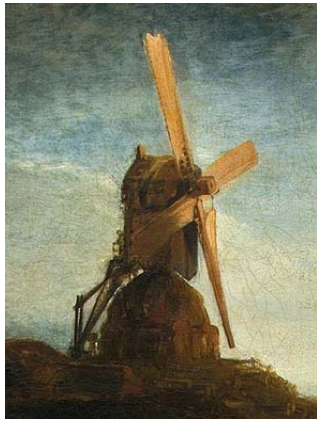
'De Molen' (detail)

Welnu, of men De Molen imposant vindt lijkt me kwestie van smaak. Maar imposant of niet, wat mij onmiddellijk opviel is dat deze molen, gezien van voren, rechtsom zou draaien wanneer de wind er vat op zou kunnen krijgen (zie het detail hiernaast). Echter, in ons land draaiden—en draaien nog immer—alle traditionele windmolens linksom, dus van voren gezien tegen de wijzers van de klok in. 2 Daarvoor zijn, volgens sommigen, redenen die te maken hebben met de structuur van het materiaal (overwegend hout) waarvan de bewegende delen gemaakt werden, maar volgens molenaars die ik daarover geraadpleegd heb is dat allerminst zeker. Misschien is er eerder sprake van een traditie die berust op een natuurlijke voorkeur van rechtshandigen voor linksomdraaiende bewegingen die enige spierkracht vereisen, zoals malen, een suggestie die mij als (linkshandige) ergonoom weliswaar aanspreekt, maar die evenzeer valt te betwijfelen. En tenslotte menen sommigen dat het kruien bij ruimende en vaak in kracht toenemende wind gemakkelijker is als de molen linksomdraaiend is.