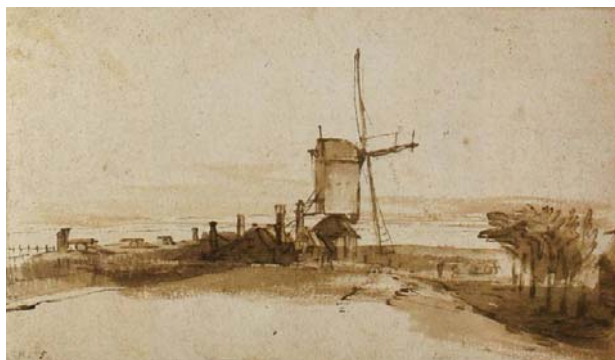
Rembrandt: 'De molen op het Blauw hoofd' (Lubomirski Museum, Lwow)

Maar linksomdraaien doen ze hoe dan ook. Is het dan aannemelijk te maken dat Rembrandt om puur artistieke redenen bij het schilderen van De Molen besloten heeft het met de (fysieke) realiteit en de traditie van de draairichting op een akkoordje te gooien? En welke redenen zouden dat dan kunnen zijn? Of zou Rembrandt, ontegenzeggelijk een nauwkeurig waarnemer van de natuur en als molenaarszoon een 'ervaringsdeskundige' bij uitstek, hier een steek hebben laten vallen? En dat in 1650, met een ervaring van zo'n dertig jaar als kunstschilder en, niet te vergeten, als etser? Andere afbeeldingen, zoals die van de molen op het Blauw hoofd, een bolwerk in Amsterdam, tonen dat de meester moeiteloos en trefzeker linksdraaiende molens kon neerzetten.