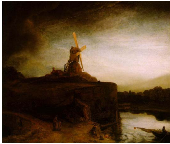
'De Molen' (National Art Gallery, Washington D.C.)

De Molen is de titel van het hierboven afgebeelde schilderij dat op het ogenblik te zien is in het Museum "De Lakenhal" te Leiden waar tot begin januari 2007 de tentoonstelling Rembrandts Landschappen loopt. Van mijn bezoek aan deze tentoonstelling werd ik niet vrolijk: Misschien keek ik daarom met minder dan de vereiste eerbied naar De Molen , volgens de catalogus afkomstig uit The National Art Gallery in Washington D.C. Het wordt door de organisatoren van de tentoonstelling geprezen als "het stuk dat ooit het bekendste landschap van de meester was." Dat klinkt niet bijzonder vertrouwenwekkend. Zij voegen hier evenwel ter geruststelling aan toe: